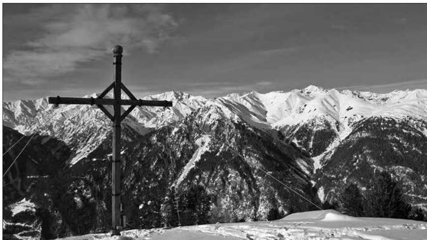
Das Bild zeigt einen Blick vom Pfrudigerkopf (2.149 Meter).

Bestens organisiert von Sportfreund Roland Scheunert trafen sich 21 Wintersportfreunde vom 18. bis 21. Januar 2019 wieder einmal in Pfunds/Österreich zu einem gemeinsamen verlängerten Ski-Wochenende.